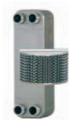
Fusion-bonded Plate Heat Exchangers

Благодаря революционным разработкам в области использования материалов и технологий производства, Альфа Нова 76 является первым в мире паяным пластинчатым теплообменником, полностью изготовленным из нержавеющей стали. Он является исключительно компактным, учитывая его способность выдерживать огромные нагрузки при теплопередаче. Его высокая устойчивость к коррозии обеспечивает гигиеничность и экологическую безопасность.